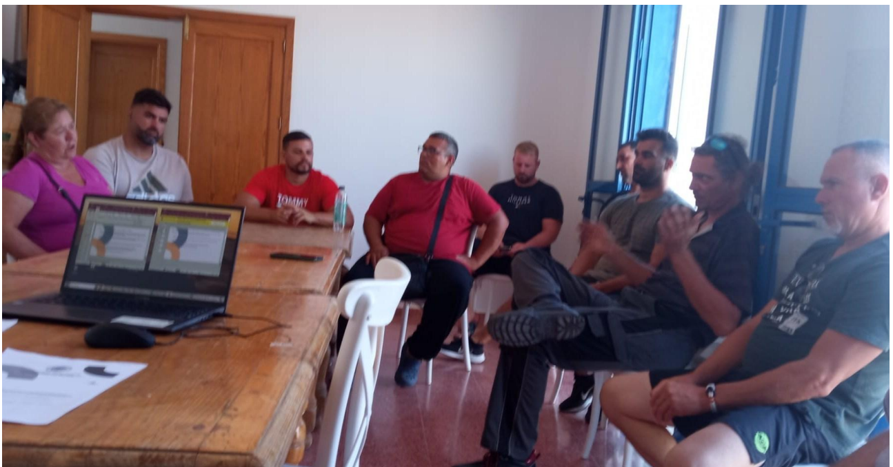
Momento de la sesión de participación en la Cofradía de Pescadores de Castillo del Romeral.