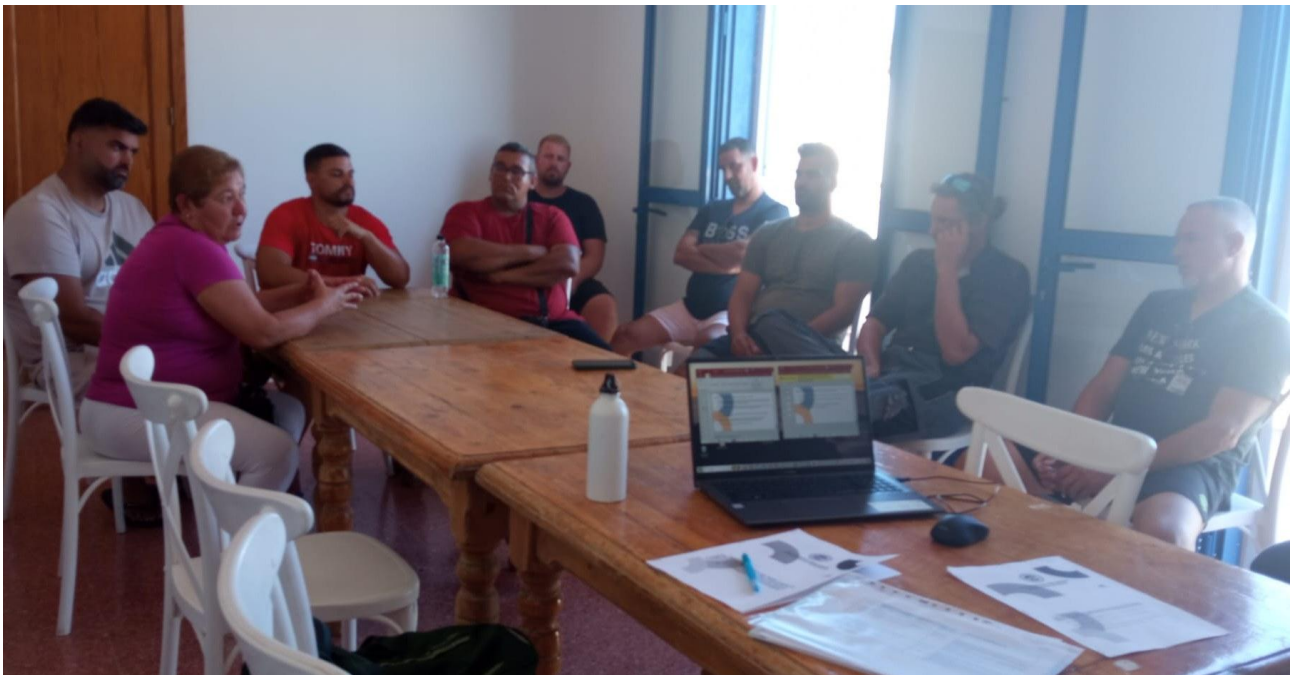
Momento de la sesión de participación en la Cofradía de Pescadores de Castillo del Romeral.