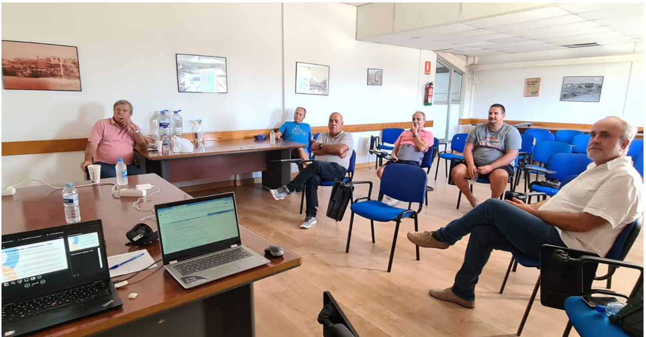
Momento de la sesión de participación en la Cofradía de Pescadores de Arguineguín.