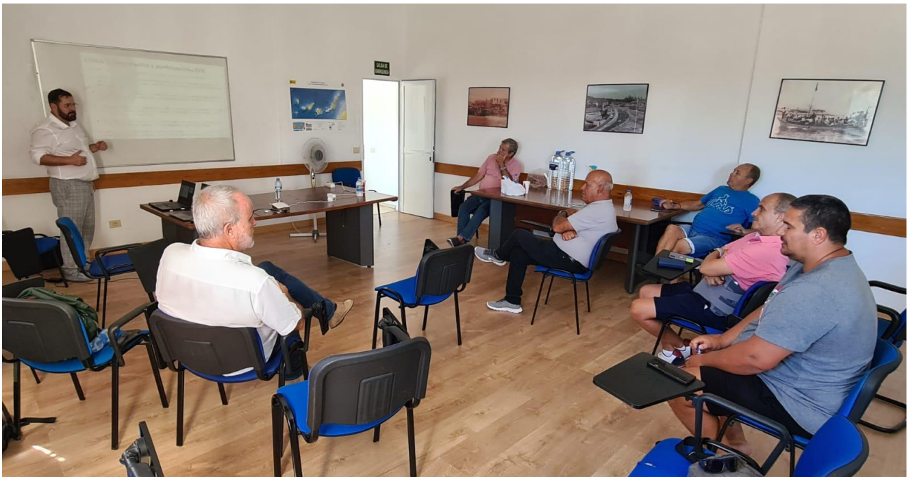
Momento de la sesión de participación en la Cofradía de Pescadores de Arguineguín.