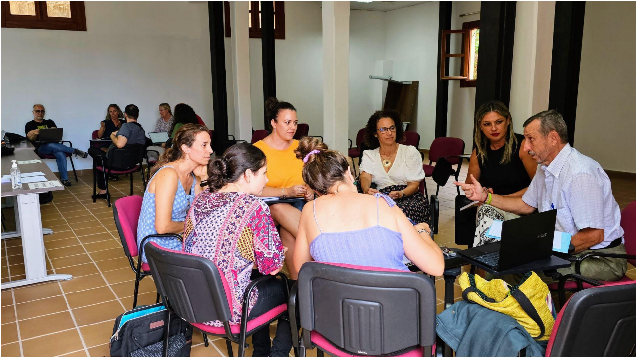
Momento de la sesión de participación con el sector privado y las asociaciones.