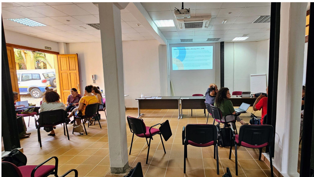
Momento de la sesión de participación con el sector privado y las asociaciones.