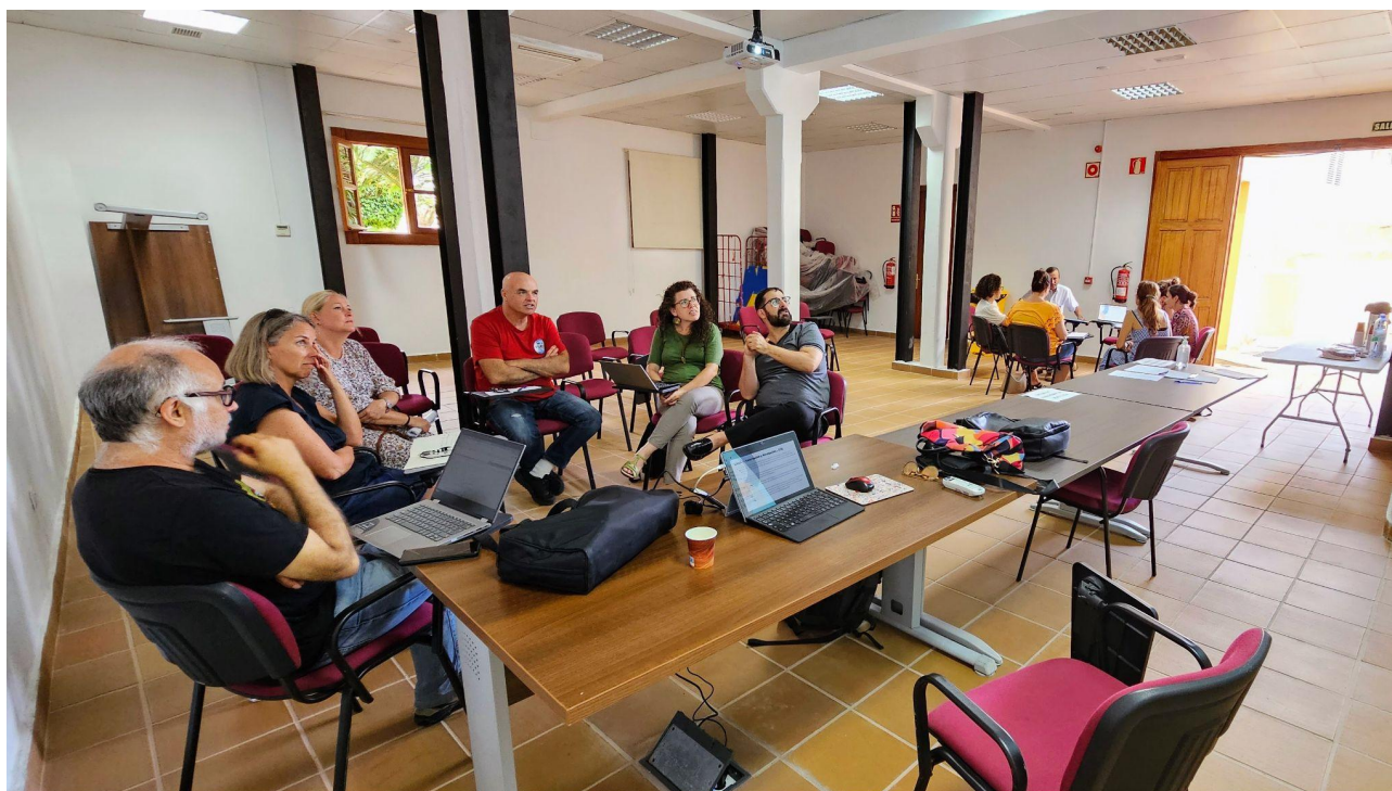
Momento de la sesión de participación con el sector privado y las asociaciones.