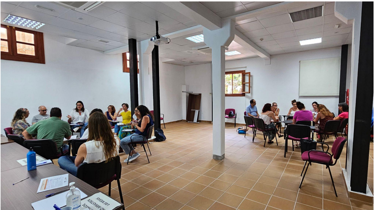
Momento de la sesión de participación con el sector público.