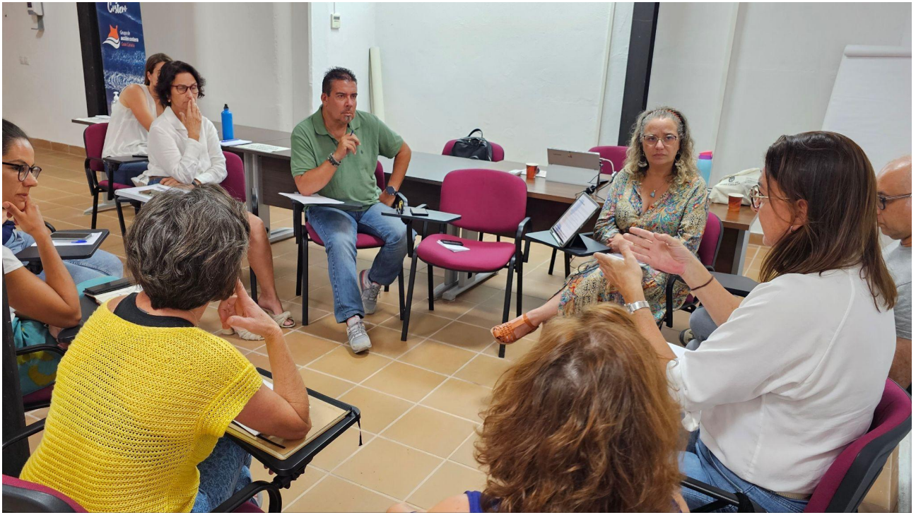
Momento de la sesión de participación con el sector público.